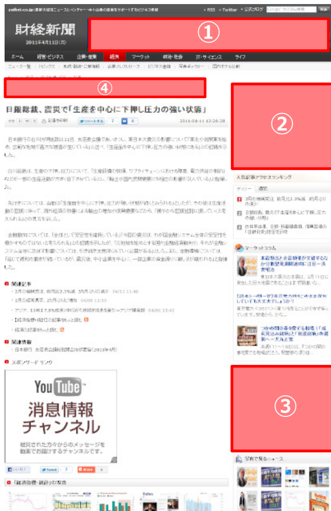
広告掲載面のイメージ

○インプレッション数（広告の表示回数）を指定してご購入いただく方式です。ご購入いただいたインプレッション数の分だけ確実に広告が表示されます。