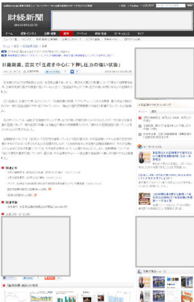
記事掲載面のイメージ

ご提供いただいた資料（製品情報、リリース情報等）をもとに、製品やサービスに関する記事体の広告を制作・掲載する広告メニューです。